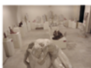
Exposición de Florentino Trapero