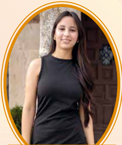
Marwa · Dama ·