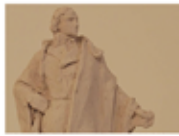
Boceto de Moratin