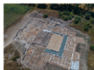
Yacimiento de Santo Lucía