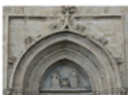
Iglesia de Santa María