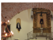
Ermita Sto. Cristo de la Peña