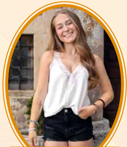
Alba · Dama ·